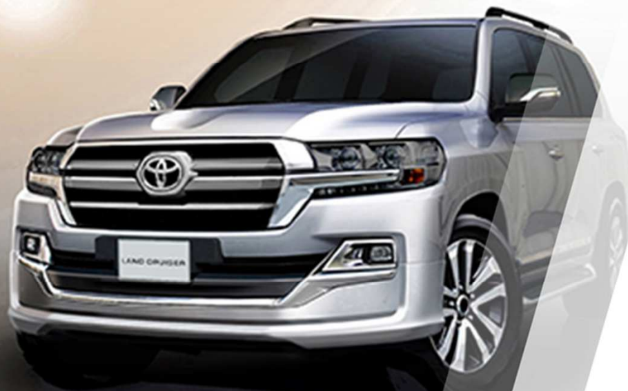
LC200 19YM Special Edition