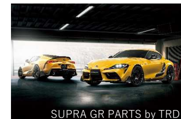
SUPRA GR PARTS by TRD