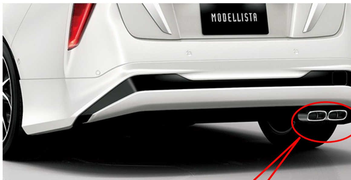
マフラーカッター