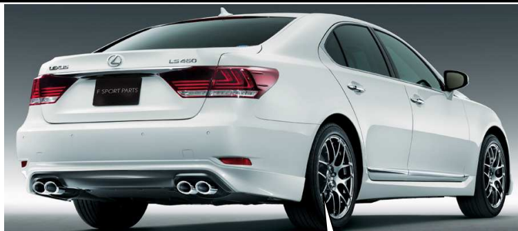
19インチアルミホイール