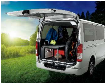
コンプリートカー (ハイエースMRT*)