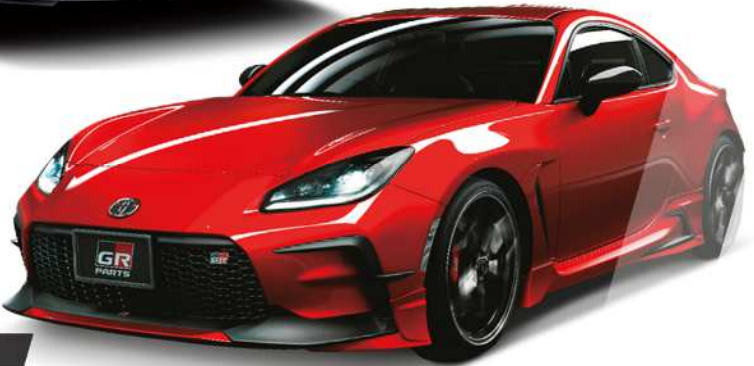
GR PARTS GR86 GR PARTS