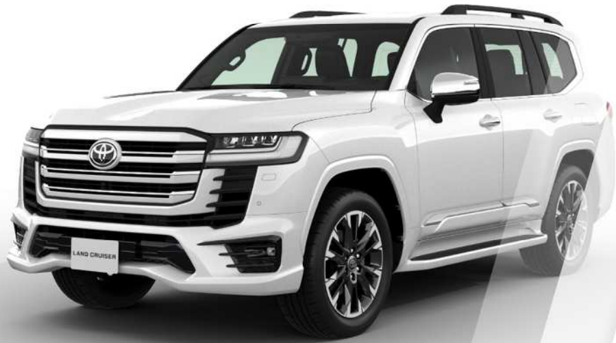
LAND CRUISER 300 Overseas Ver. *