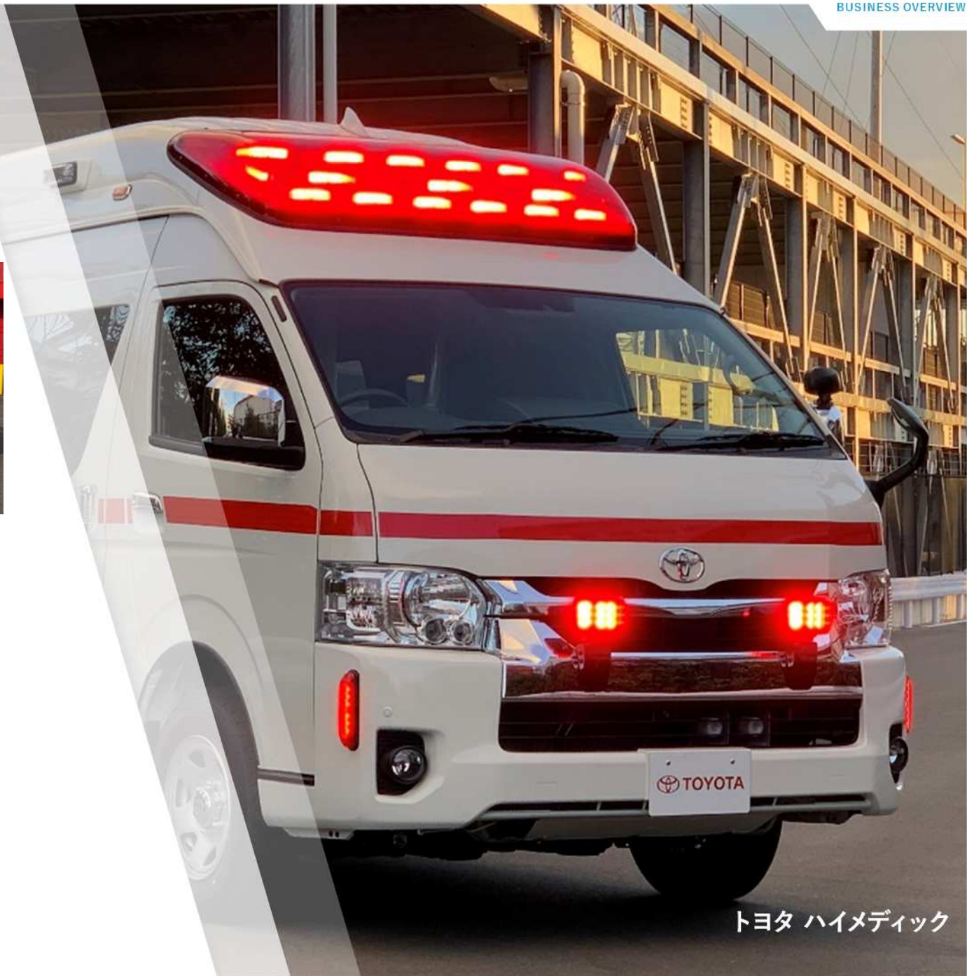
トヨタ ハイメディック