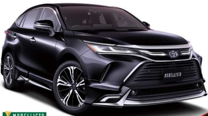
MODELLISTA HARRIER MODELLISTA Ver.