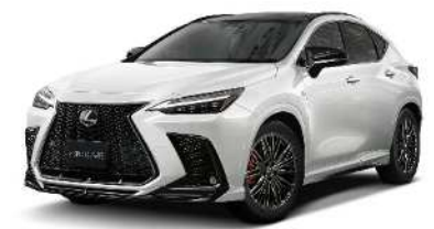
LEXUS NX F SPORT PARTS