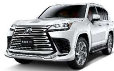
LEXUS LX MODELLISTA