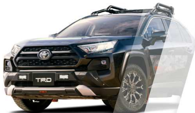
Racing Development TRD RAV4 TRD Field Monster