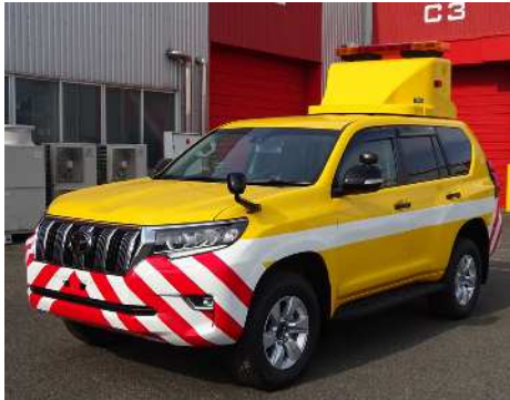
道路パトロールカー

各種特装車、コンプリートカーの企画・開発・生産 (救急車、道路パトロールカー、ハイエースMRT*など)